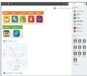
【製造日報・各種マスタ管理】